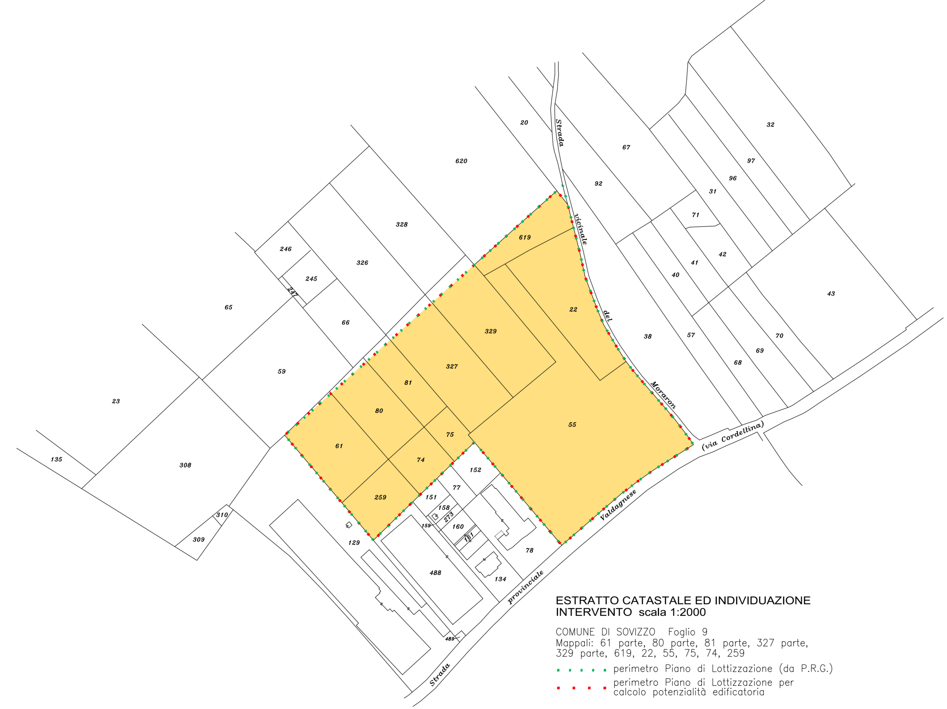
ESTRATTO CATASTALE ED INDIVIDUAZIONE INTERVENTO scala 1:2000 COMUNE DI SOVIZZO Foglio 9 Mappali: 81 parte, 80 parte, 81 parte, 327 parte, 328 parte, 619, 22, 25, 74, 258 - - - - - perimetro Piano di Lottizzazione (da P.R.G.) - - - - - perimetro Piano di Lottizzazione per calcolo potenzialità edificatoria